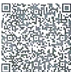
เอกสารแนบ

เพื่อทราบและถือเป็นแนวทางปฏิบัติ พร้อมนี้ได้แนบข้อกฎหมาย หน่วยงานศุลกากรพื้นที่ และตัวอย่างหนังสือตาม QR CODE ท้ายหนังสือนี้